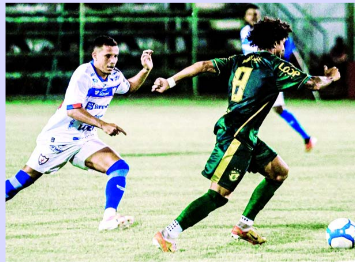
ÁGUIA DE MARABÁ

LANCES - E a TV Meio fará a transmissão do duelo, ao vivo, levando todos os detalhes para o telespectador, com narração de Daiton Meireles, comentários de Denis Constantino e reportagens de Thiago Black. O jogo promete ser disputado, com ambas as equipes buscando melhorar suas posições na tabela.